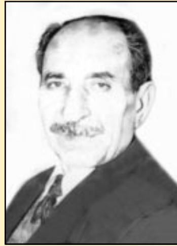
* نووسهرو شاعیرو رۆژنامه نووس

له ٢٥/٣/١٩٩٣دا گۆقاری خنجیلانهی (ههنگ) چاوی به رۆشنایی کوردستانی راپه رپو هه لێناو که وته گروگال و تهستیره ی ژيانی که وته ورشه و رووناکیی به میشک و زهینی روونی منداله بی مرادهکانی کوردستان به خشی.